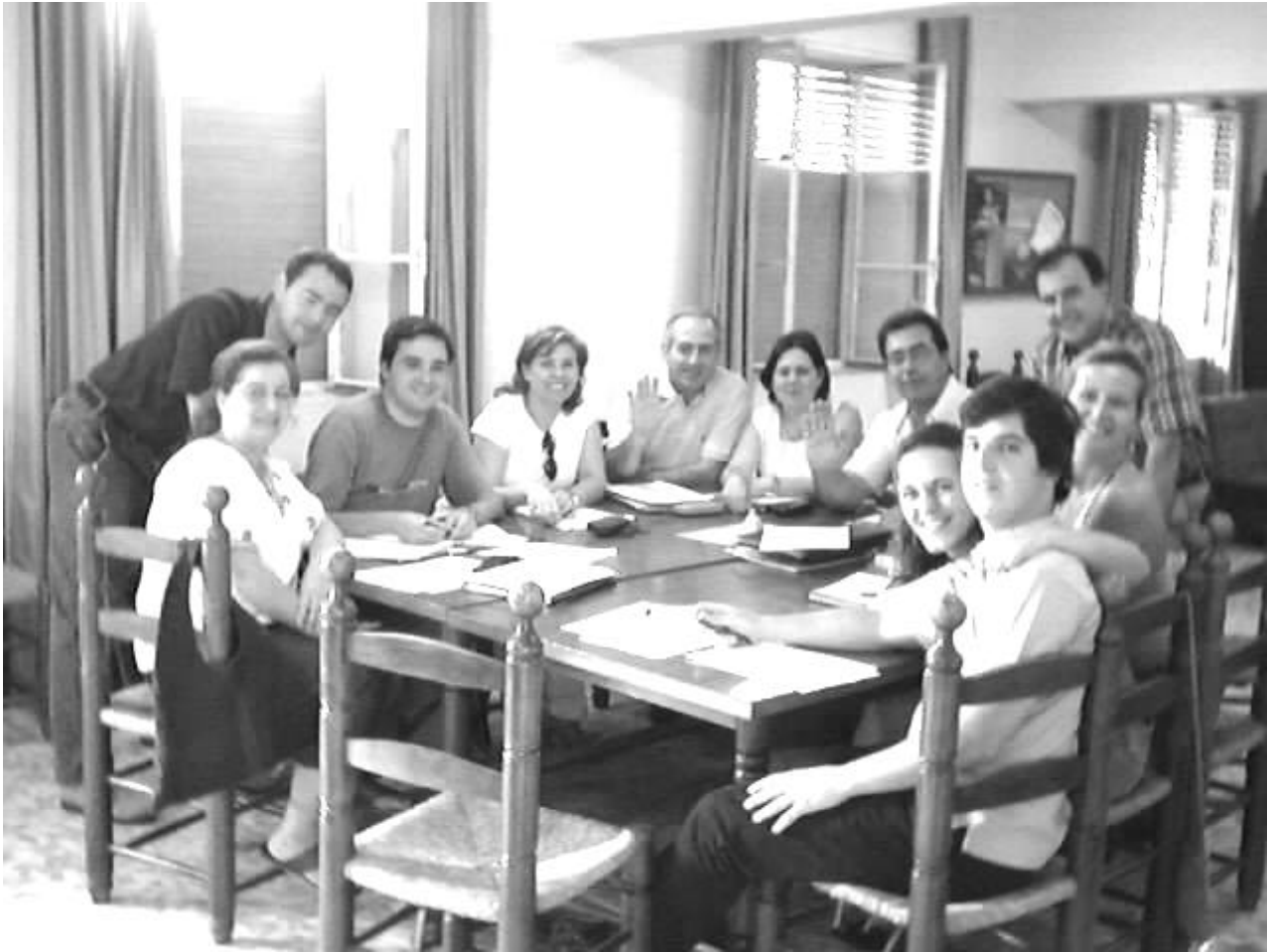
Reunión del curso de asesores en Jerez

ÁGORA MARIANISTA. ¿Qué significa eso?. Si nos vamos al diccionario, ÁGORA significa lugar de reunión de asamblea de unión de discusión... es el lugar de la familia marianista en España. Os animo a visitarlo: www.marianistas.org . En él se encuentran representadas todas las ramas de la familia: Religiosos, Religiosas, Fraternidades, CEMI,..cada una de ellas tienen su propia página web. Unas la tienen más avanzada y completas que otras pero al fin y al cabo todas se encuentran ahí formando la gran familia marianista. La web de fraternidades marianistas de Madrid es www.marianistas.org/fraternidadesm . A la cual también se puede acceder entrando en la sección Familia Marianista cuyo enlace se encuentra en la parte superior derecha de la página principal de Ágora. Aunque aún no se encuentra acabada podéis ir encontrando diversos contenidos.