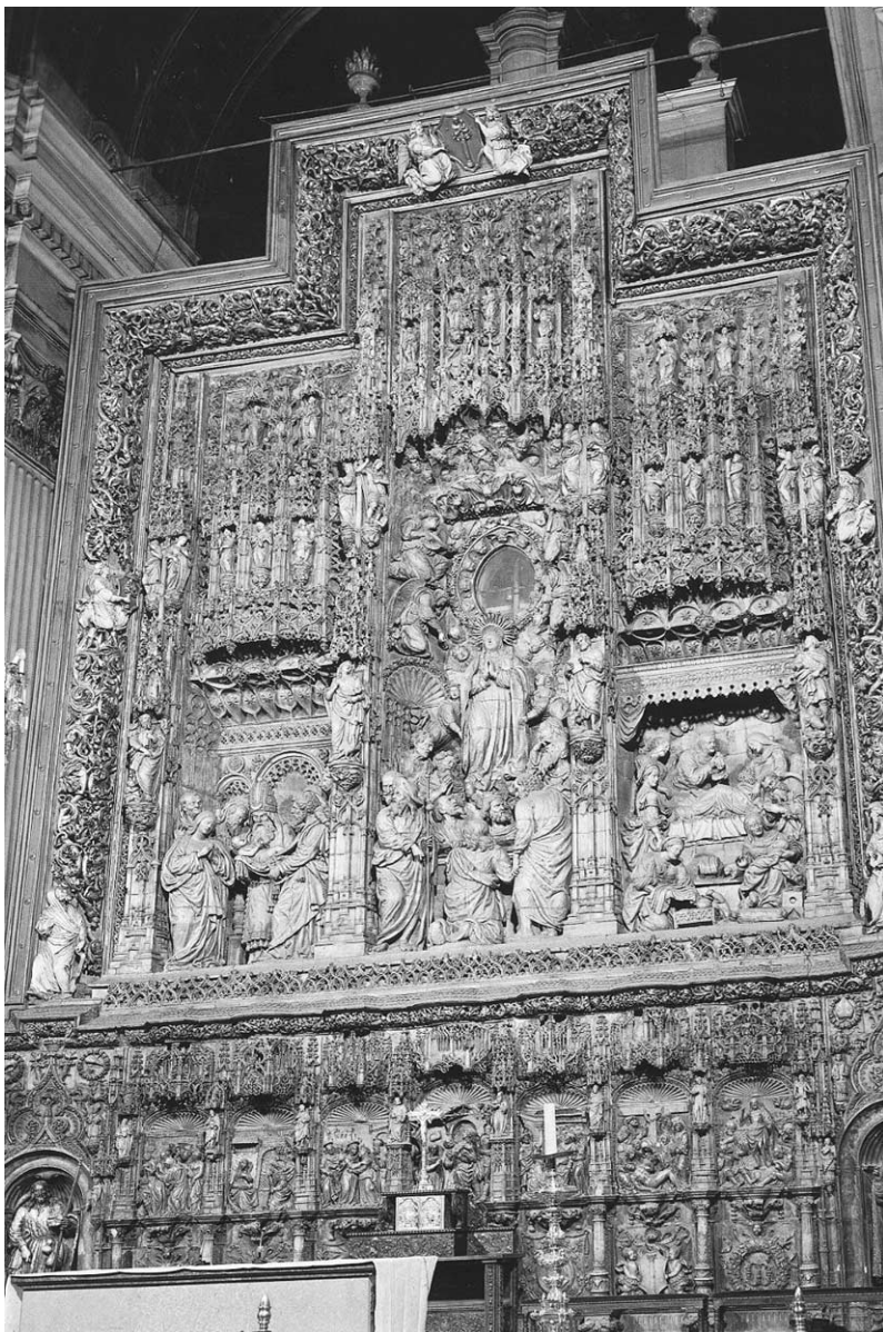
Santa María: retablo mayor.