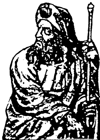
Santiago el Mayor.