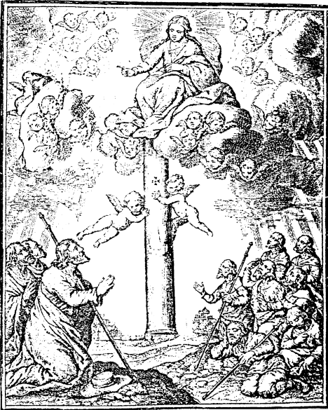
Aparición de la Virgen a Santiago.

de su Madre. «Mira esta columna en que me asiento. Sabe que mi Hijo la ha enviado desde lo alto por manos de los ángeles. En este lugar la virtud del Altísimo obrará prodigios y milagros admirables por mi intercesión y reverencia a favor de aquellos que imploran mi auxilio en sus necesidades, y la columna permanecerá en este lugar hasta el fin del mundo, y nunca faltarán en esta ciudad fieles adoradores de Cristo» 19 . El apóstol, radiante de gozo, manifestó su agradecimiento a la Madre de Jesús, a la que los ángeles devolvieron a Jerusalén.