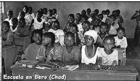
Escuela en Bero (Chad)