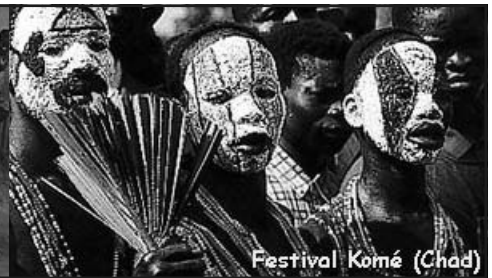
Festival Komé (Chad)