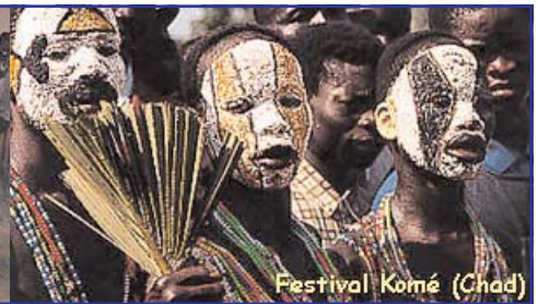
Festival Komé (Chad)