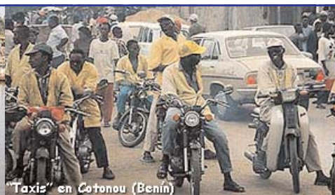
Taxis en Cotonou (Benín)