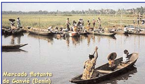
Mercado flotante de Ganvié (Benín)