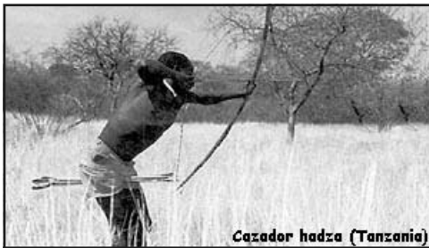
Cazador hadza (Tanzania)