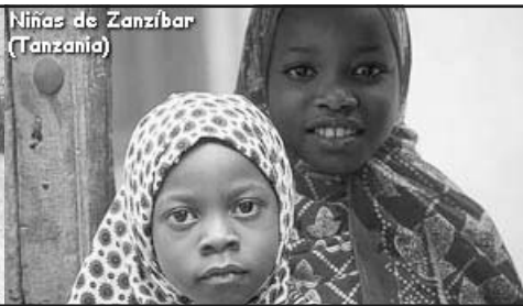
Niñas de Zanzibar (Tanzania)