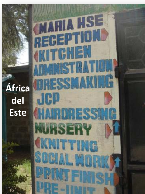
África del Este