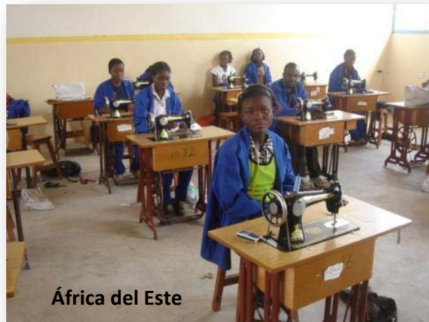
África del Este

La misma estructura de la obra se rige por esos valores, y sus relaciones internas son un ejemplo de justicia y respeto a los derechos de las personas. Sus responsables están atentos a cumplir las leyes y obligaciones laborales, de tal manera que su propia organización es un ejemplo de los mismos valores en los que pretende educar. Los agentes de la educación, trabajadores y voluntarios, tienen la oportunidad de capacitarse adecuadamente y de recibir una formación permanente, de tal manera que se sienten partícipes activos y responsables en la consecución de los objetivos propuestos.